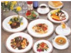
■ レストランベルレーヌ

お香・香水・ミストスプレー・ジェルキャンドル・ハーブ石けん・マッサージオイル・ドライフラワーのリース・アレンジメント