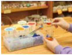
■ 手作り体験メニュー

お香・香水・ミストスプレー・ジェルキャンドル・ハーブ石けん・マッサージオイル・ドライフラワーのリース・アレンジメント