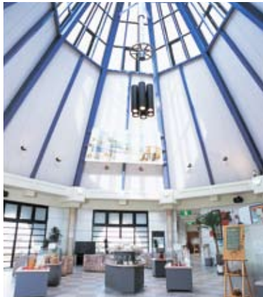
■ エントランスホール

香りをテーマにした、アロマやリース・香水などの手作り体験が楽しめるテーマ館。香りに関する展示やお料理を楽しめるレストランなどもあり、思う存分香りを楽しめます。香りとふれあう癒しの時をお過ごしください。